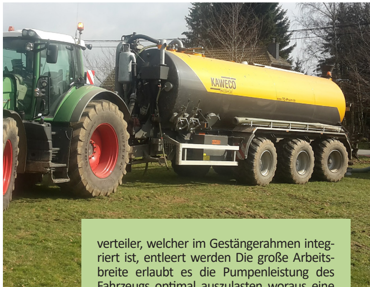
Beispielfoto einer „Kaweco Schiebeachse“ mit 750 mm Ausschub

verteiler, welcher im Gestängengerahmen integriert ist, entleert werden Die große Arbeitsbreite erlaubt es die Pumpenleistung des Fahrzeugs optimal auszulasten woraus eine beachtliche Schlagkraft resultiert.