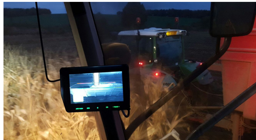
Das Claas AUTO FILL basiert auf dem Prinzip der digitalen 3-D-Bildanalyse. Es sorgt stets für eine Effizienzsteigerung durch eine optimale Befüllung der Wagen. Und dies selbst bei Dunkelheit.