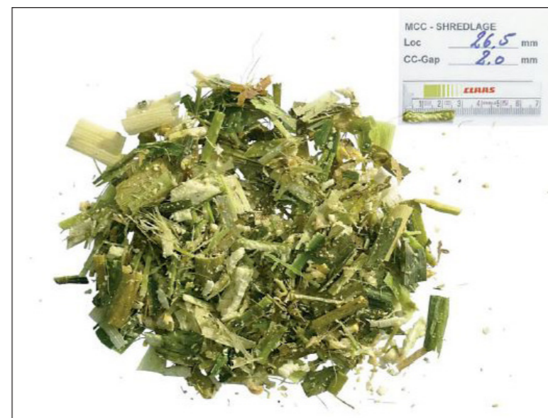
Frisches Erntegut gehäckselt mit Shredlage-Technologie