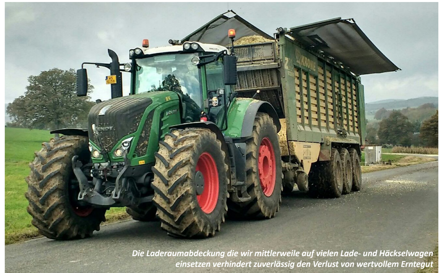
Die Laderaumabdeckung die wir mittlerweile auf vielen Lade- und Häckselwagen einsetzen verhindert zuverlässig den Verlust von wertvollem Erntegut

Im April 2016 haben wir uns, zusammen mit einigen interessierten Kunden, die SHREDLAGE-Technologie von Vertretern der Firma Claas erklären lassen.